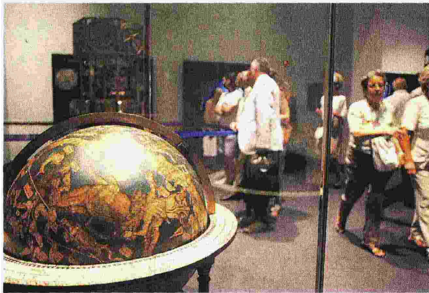
Visitatori alla mostra dedicata a Janello Torriani